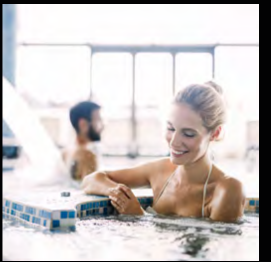
Thermes VALVITAL à 8 minutes à pied