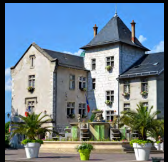
Mairie à 2 minutes à pied