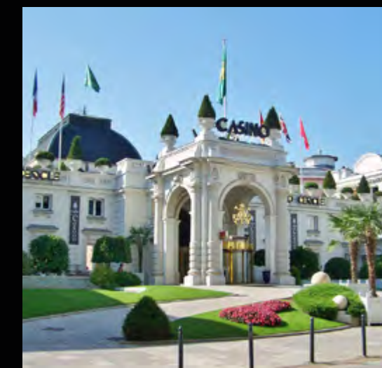
Casino Grand-Cercle à 1 minute à pied