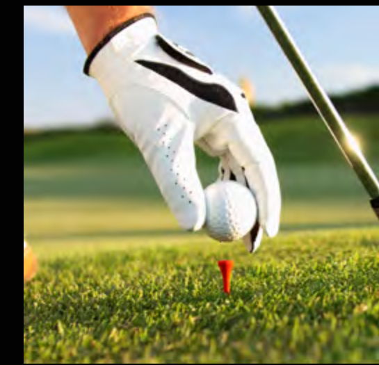
Golf Country Club à 5 minutes en voiture