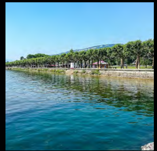
Esplanade du Lac à 10 minutes en vélo