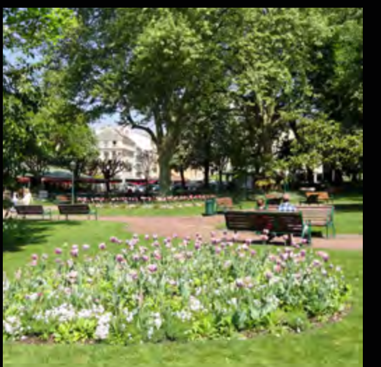
Parc Floral des Thermes à 3 minutes à pied